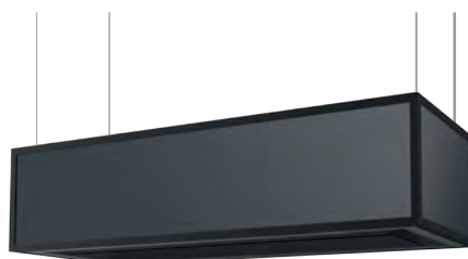
Variante: ohne Regalelemente

*Artikelergänzungen verlängern die angegebenen Lieferzeiten